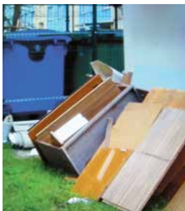
Odpady wielkogabarytowe odbierane są raz w miesiącu (zabudowa wielorodzinna) lub raz na kwartał (osiedla domków jednorodzinnych).

To te, powstające w naszych domach i mieszkaniach, które ze względu na duże rozmiary lub wagę nie mieszczą się w standardowych kontenerach na śmieci. Do tej grupy odpadów zaliczane są m.in.: stare, niepotrzebne meble, dywany, materace czy rowery, zabawki dużych rozmiarów, stoły, krzesła, sofy, szafy, tapczany, łóżka, fotele, wykładziny, panele podłogowe i ścienne, pierzyny, kołdry, koce, wózki dziecięce, stolarka okienna i drzwiowa, niepotłuczona armatura sanitarna.