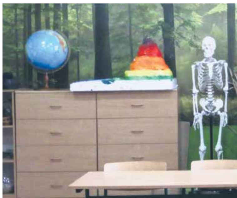
Zielona pracownia w szkole w Mikulczycach, która powstała dzięki dofinansowaniu z WFOŚiGW w Katowicach.

Jeszcze przez miesiąc, do 14 lutego, zabrzańskie szkoły mogą składać wnioski o dofinansowanie na stworzenie nowoczesnej pracowni przyrodniczej. To w ramach kolejnej edycji konkursu „Zielona Pracownia - Projekt 2020”, którą ogłosił Wojewódzki Fundusz Ochrony Środowiska i Gospodarki Wodnej w Katowicach.