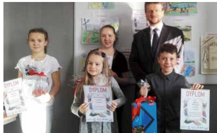
Laureaci konkursu pt. „Ciepłe spojrzenie na Zabrze przyszłości”, które zorganizowało Zabrzańskie Przedsiębiorstwo Energetyki Ciepłej Sp. z o.o.