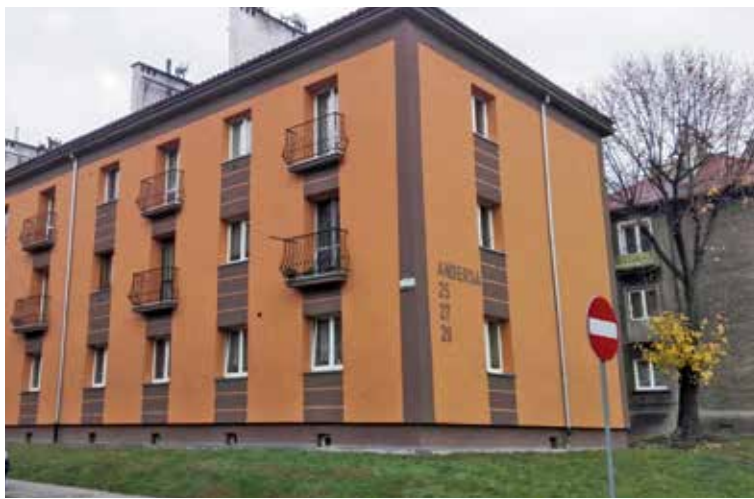
Do zwolnienia z podatku od nieruchomości uprawnia każdy remont, który wpływa na poprawę estetyki wszystkich ścian budynku. Na zdjęciu budynek w Rokietnicy.

Zwolnienie z części podatku od nieruchomości (nie dotyczy składnika gruntowego podatku) daje oszczędność rzędu kilkudziesięciu złotych rocznie, a może ono trwać przez kolejne lata, nawet do siedmiu, od daty zakończenia remontu. Maksymalna kwota zwolnienia wyliczana jest na podstawie faktur za remonty. Przyjmuje się 50 procent sfinansowanych z własnych środków wydatków na przeprowadzenie remontu elewacji z uwzględ-