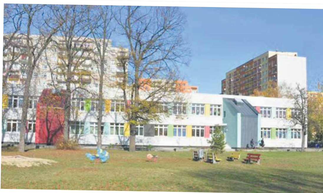
Nowa elewacja to tylko zewnętrzny efekt gruntowej termomodernizacji, jaką przeszedł budynek Przedszkola nr 16 w Zaborzu.

Dodają, że termomodernizacja tej placówki oświatowej była możliwa