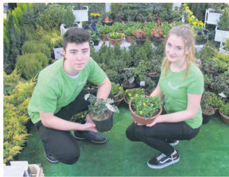
Ubiegłoroczna akcja wymiany surowców na prezenty w Centrum Handlowym Platan. Tym razem odbędzie się 23 i 24 marca.

O szczegółach będziemy informować w kolejnych Nowinach.