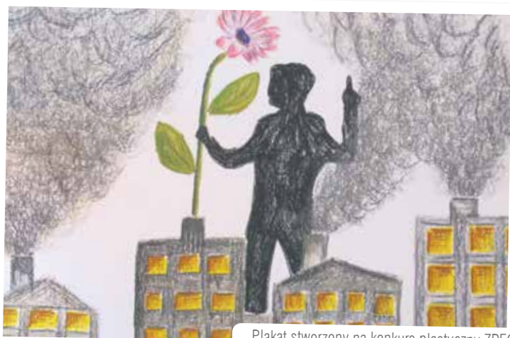
Plakat stworzony na konkurs plastyczny ZPEC

Pomysł przedstawiony przez Mateusza Morawieckiego jest następujący: część pieniędzy, uzyskanych ze sprzedaży jednorazowych reklamówek (od 1 stycznia mają być płatne, mówi się o 20 gr.) zostanie przekazana samorządom z czarnej listy, a te mają je wydać na walkę ze smogiem.